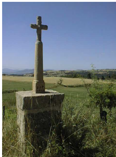
la croix du Viaou à Rochegut

Patrimoine: au bourg, église romane classée monument historique et vestiges de son prieuré - maisons Belle Epoque - site et oratoire du Rochain - hameau double de Martinange ( chapelle, ensemble lavoir-puits-travail ) - église de Rochegut - nombreuses croix.