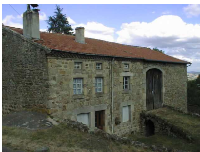
ferme à montée de grange à Rochegut