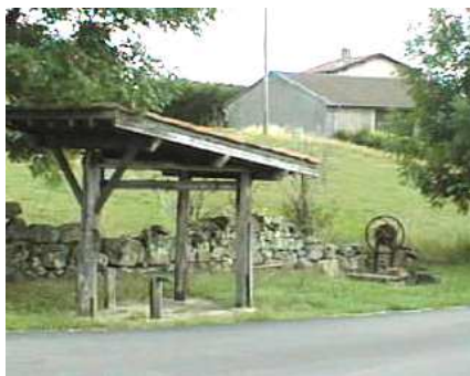
le "travail" et le puits de Martinange