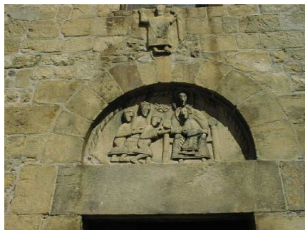
le tympan de l'église romane