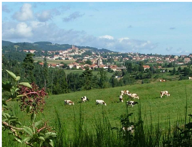
Vue sur Saint-Nizier et Saint-Bonnet-le-Château

D A l'épicerie, emprunter la rue centrale, direction St-Maurice-en-Gourgois. 1 A la première rue, tourner à gauche et descendre tout droit. En bas, prendre le chemin à droite qui longe le bourg. Arrivé à la petite route goudronnée, l'emprunter à main gauche et rejoindre la départementale. 2 Traverser la départementale et s'engager dans le chemin en face, longeant un manège équestre. A une patte d'oie, prendre à gauche et continuer tout droit. Arrivé sur un chemin balisé jaune (circuit du Huit de Rozier), tourner à droite et marcher 100m. 3 Au goudron, prendre à gauche en direction de Montméal. A l'entrée du hameau, bifurquer à gauche, entre les maisons et suivre le chemin herbeux. Plus loin, on rejoint le circuit balisé jaune. 4 Prendre à droite dans le hameau de Guéret Blanc, puis au centre du hameau tourner à droite et suivre un grand chemin de terre, qui traversera un bois. A un carrefour, nommé « La